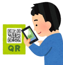
動画ホームページ QRコード