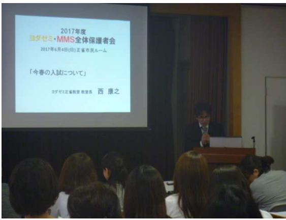
全体保護者会当日の様子

6月4日(日)、摂津市民ルームにて、平成29年度全体保護者会を開催致しました。当日は、第1部で公立入試改革、それに伴う今春の当塾実績に関してのご説明、第2部では私立高校の先生による講演会を行いました。