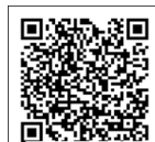
動画ホームページ